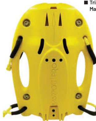
■ Trident fjölgeislaneminn í Marport Pro línunni.